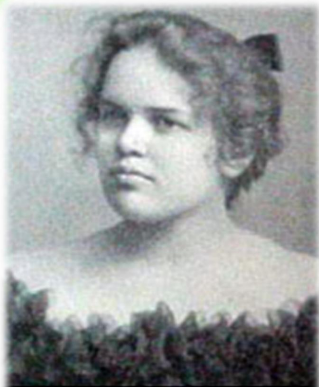
Adelaide Crapsey, creator of the American cinquain.

Синквейн – нерифмованная пятистрочная стихотворная форма, написанное в соответствии с определёнными правилами.